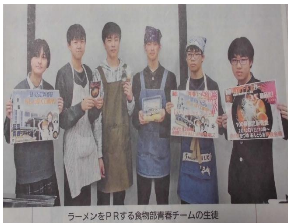
ラーメンをPRする食物部青春チームの生徒

鹿角市の花輪高校の生徒が考案した「花高青春ラーメン」が12日、道の駅かづので販売される。みそ味で、生麺とスープが入った100セット限定。食物部の有志ら1年生9人でつくる「青春チーム」が、昨秋のイベントで販売したラーメンのスープを改良し、商品化した。販売は午前10時から。